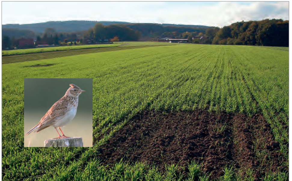
Lerchenfenster in ansonsten dichten Getreidebeständen, bieten der Feldlerche Raum für Brut und Aufzucht der Jungen.

Ein Lerchenfenster ist eine Fehlstelle im Acker. Wie ein richtiges Fenster auch soll es vor allem Licht auf und in die Fläche bringen, da Feldlerchen eine offene, lückige und nicht zu hohe Vegetation bevorzugen. Die Fenster verschaffen den Alttieren die Möglichkeit, in die Pflanzenbestände einzufiegen. In unmittelbarer Nähe der Fenster